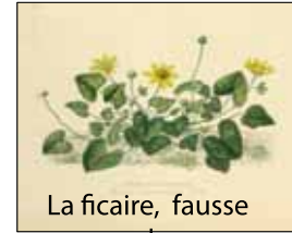
La ficaire, fausse renoncule