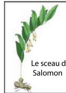
Le sceau de Salomon

Rejoignez-nous samedi 24 ou dimanche 25 mai pour en savoir davantage sur la nature à Sonchamp!