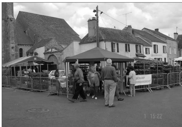
La foire aux plantes

Nous remercions tous nos « clients » qui ont contribué au succès de cette manifestation. Elle constitue la source principale des revenus de l'association, devant les cotisations des membres. Grâce à ces ressources, nous pouvons financer des actions de mise en valeur de notre environnement, comme cette année l'édition d'un guide de promenades à Sonchamp.