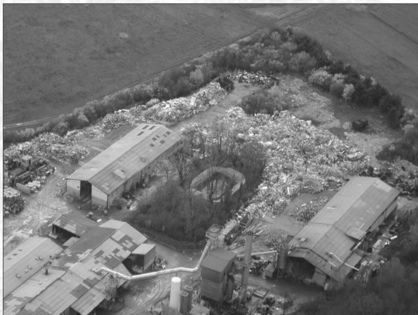
L'usine de la Chaudière en 2004

La Commune récompense chaque année les habitants qui fleurissent leurs maisons et jardins. Notre association incite également les Sonchampoises à fêter le