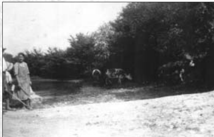
Ancienne mare à la Hunière, aujourd'hui comblée et utilisée comme potager.

La végétation, riche et abondante, varie selon l'emplacement de la mare. On y trouve des saules et des joncs mais également des lentilles d'eau, des prêles ou des espèces plus rares en Ile de France comme la Gypsophile des murs ou l'Epilobe. Les mares de champ étant régulièrement labourées, elles accueillent des plantes annuelles comme la Damasonie étoilée qui est une espèce protégée.