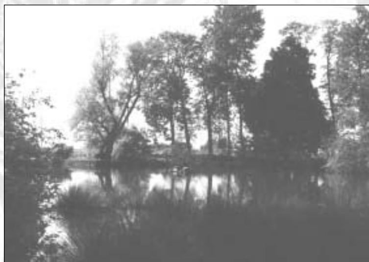
La mare de la Chéraitte, rendez-vous des pêcheurs.

Si les mares agrémentent notre paysage, elles constituent surtout une importante réserve d'espèces animales et végétales qu'il convient de préserver.