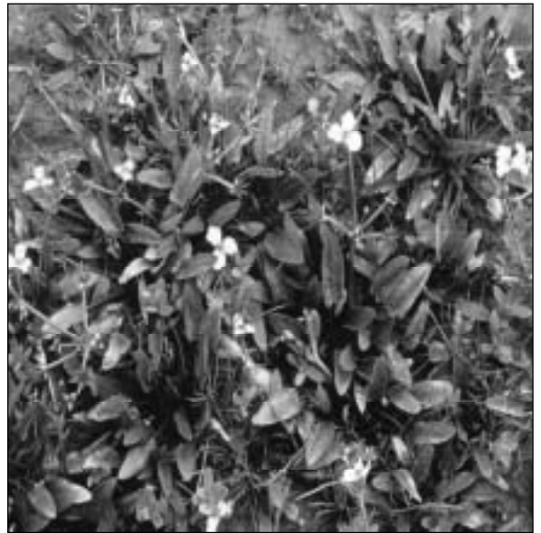
La Damasonie étoilée

Elles peuvent être prétexte à un pique-nique en forêt comme la mare de la fosse aux loup, entre les Chênes secs et Clairefontaine. Certaines ne se remplissent qu'en hiver lorsque l'eau s'accumule dans le creux d'un terrain imperméable. D'autres, creusées à proximité des fermes, sont souvent d'anciens abreuvoirs.